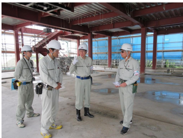
役員安全衛生パトロール

本社・支店にて毎月の安全衛生パトロールを実施し、安全週間や年末には役員安全衛生パトロール及び社協合同による安全衛生パトロールを実施し、労働災害防止の指導や職場環境改善指導を行い、安全面・衛生面での意識高揚と改善を図っています。