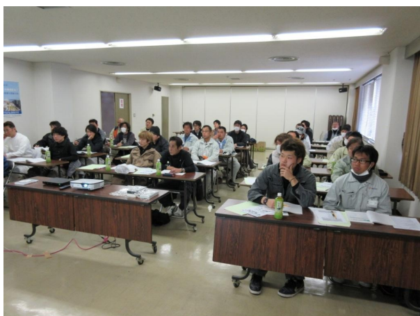
高所作業車特別教育

協力会社への教育支援として、一定の危険又は有害な業務に労働者を就かせる時などに実施しなければならない「特別教育」や、新たに現場職務に就くことになった職長に対して実施しなければならない「職長・安全衛生責任者教育」など、その事業主に代わってそれらの教育を実施しています。