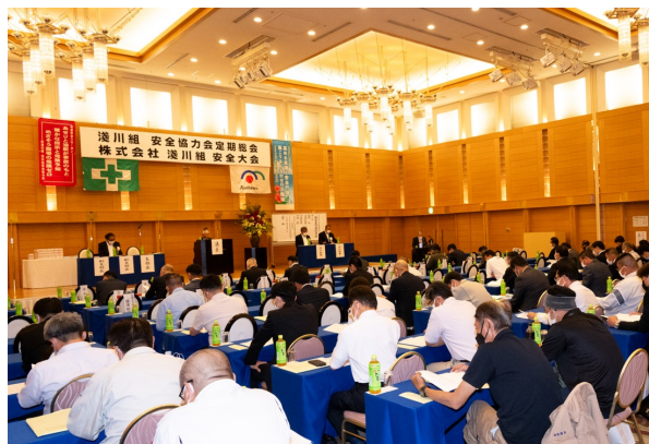
本社 2023 年度安全大会開催

毎年本社・支店では、全国安全週間準備月間である6月に安全大会を実施し、「優良事業場表彰」「協力業者事業所表彰」「協力業者職長表彰」などの安全表彰をはじめ、安全講演による安全意識の高揚と、社員の「安全宣言」により労働災害の撲滅を目指します。