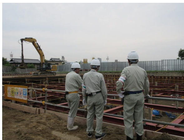
社協合同安全衛生パトロール