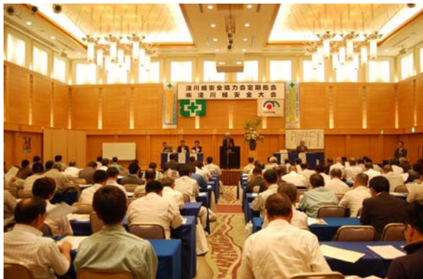
本社平成 25 年度安全大会開催

毎年本社・支店では、全国安全週間準備月間である6月に安全大会を実施し、「優良事業場表彰」「協力業者事業所表彰」「協力業者職長表彰」などの安全表彰をはじめ、安全講演による安全意識の高揚と、社員の「安全宣言」により労働災害の撲滅を目指します。