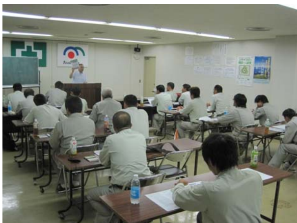
社員 AST 実施

協力会社への教育支援として、一定の危険又は有害な業務に労働者を就かせる時などに実施しなければならない「特別教育」や、新たに現場職務に就くことになった職長に対して実施しなければならない「職長・安全衛生責任者教育」など、その事業主に代わってそれらの教育を実施しています。