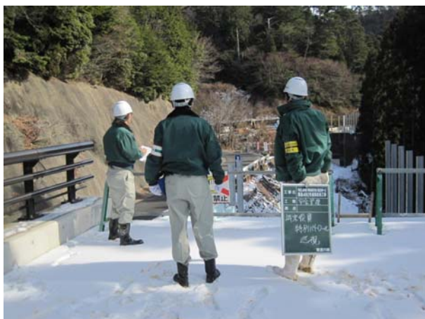
役員安全衛生パトロール

本社・支店にて毎月の安全衛生パトロールを実施し、安全週間や年末には役員安全衛生パトロール及び社協合同による安全衛生パトロールを実施し、労働災害防止の指導や職場環境改善指導を行い、安全面・衛生面での意識高揚と改善を図っています。