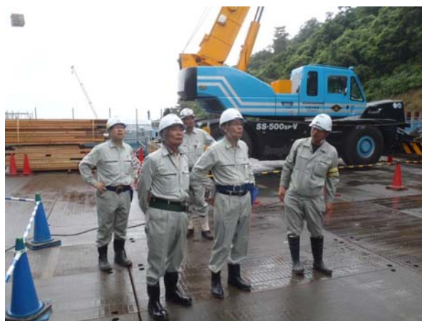
社協合同安全衛生パトロール