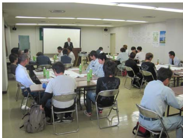
職長・安全衛生責任者教育