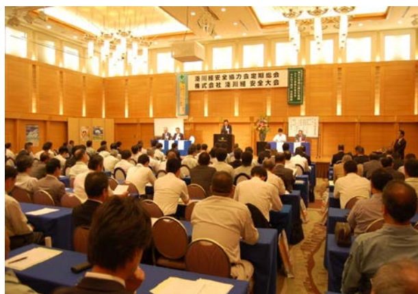
本社平成 27 年度安全大会開催

毎年本社・支店では、全国安全週間準備月間である6月に安全大会を実施し、「優良事業場表彰」「協力業者事業所表彰」「協力業者職長表彰」などの安全表彰をはじめ、安全講演による安全意識の高揚と、社員の「安全宣言」により労働災害の撲滅を目指します。