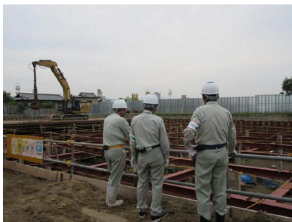
社協合同安全衛生パトロール