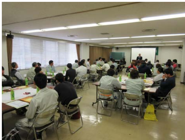
職長・安全衛生責任者教育