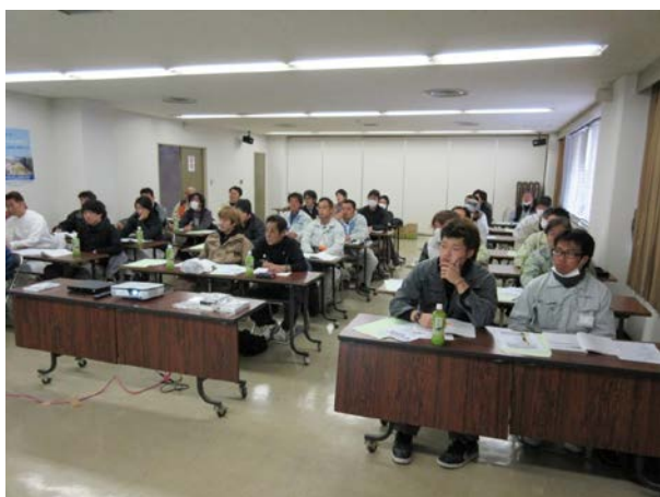
高所作業車特別教育

協力会社への教育支援として、一定の危険又は有害な業務に労働者を就かせる時などに実施しなければならない「特別教育」や、新たに現場職務に就くことになった職長に対して実施しなければならない「職長・安全衛生責任者教育」など、その事業主に代わってそれらの教育を実施しています。