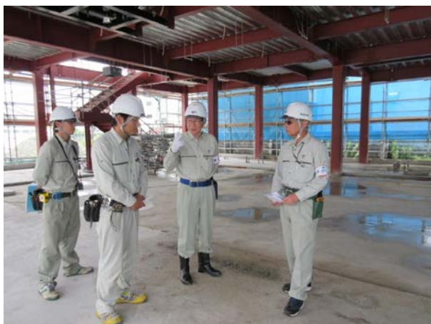
役員安全衛生パトロール

本社・支店にて毎月の安全衛生パトロールを実施し、安全週間や年末には役員安全衛生パトロール及び社協合同による安全衛生パトロールを実施し、労働災害防止の指導や職場環境改善指導を行い、安全面・衛生面での意識高揚と改善を図っています。